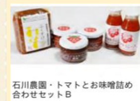
石川農園・トマトとお味噌詰め 合わせセットB