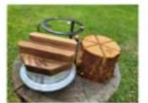
恵那産ミニスウェーデントーチ ×五徳×羽釜セット