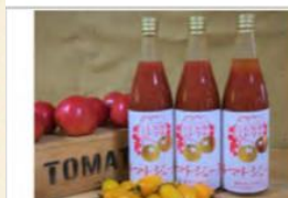
石川農園・みんなで飲もっか！ トマトジュースセットE

★お礼の品は、約 550 品目の中から お選びいただけます。 詳しくは恵那市HPをご覧ください。 例えば ↓↓↓ などなど